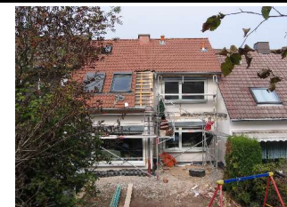
Jetziger Zustand des Gebäudes

Projekt 2: Einfamilienhaus in Trier Baujahr: 1970 Größe: ca. 107 m 2 beheizte Wohnfläche Maßnahme: Sanierung der Gebäudehülle, Einbau einer Holzpelletsheizung und einer Solaranlage Ansprechpartner(in): Jürgen Klaus