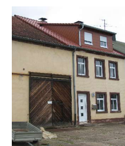
Gebäude nach der Sanierung