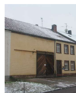
Gebäude vor der Sanierung

Projekt 7: Einfamilienhaus in Saarburg Baujahr: 1890 Größe: ca. 160 m 2 beheizte Wohnfläche Maßnahme: Sanierung vom Altbau zum Niedrigenergiehaus Einbau einer Holzpelletsheizung und einer Solaranlage Ansprechpartner(in): Augustemaria Orth